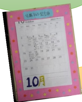
分場 365 日記念日