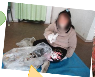
作業も頑張っています！