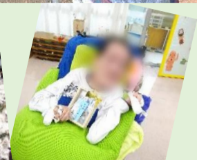
さんぽ・感謝デー製作