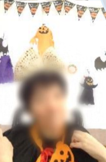
お月見会・運動会・ハロウィン