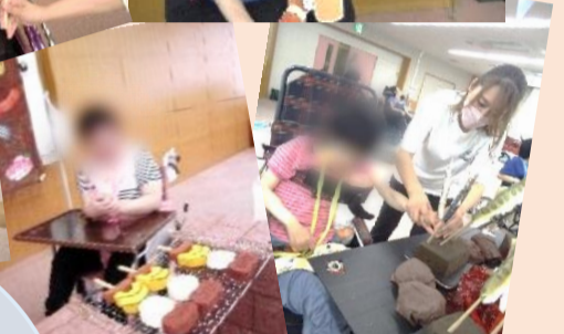
ラポートキャンプ