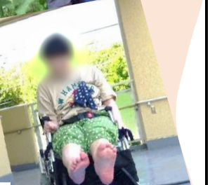
水遊び・暑中見舞い製作